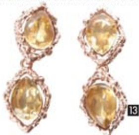
1 Dress, Alice + Olivia at Bloomingdale's. 2 AMC gold Eyeshadow, Inglot. 3 Maxi cuff, Elle Saab. 4 Leather jacket, Karl by Karl Lagerfeld. 5 Gold painted jeans, Zadig & Voltaire. 6 The DvF Sutra bracelet, H.Stem. 7 Chunky necklace, Oscar de La Renta. 8 Pendant Nada Roma, in vintage micro mosaiques, diamonds and lube sapphire, Nourbel & Le Caveller London. 9 Pigalle strass shoes, Christian Louboutin. 10 Gold sandals by Charlotte Olympia. 11 Python gold bag, Sandra at Bloomingdale's. 12 Gold clutch, Katur at Etoile. 13 Gold earrings, Oscar de la Renta at Harvey Nichols.

Still Lives Objective Image. Runway Imaxtree.